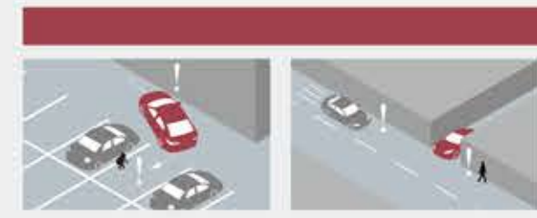
バックで駐車しようとしたら、前方の壁ですりそうに後方の見えにくいところは、子どもがいた!