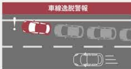
【LDWS TM 】 道路上の車線を感じし、はみ出しそうになるとドライバーに警告します。