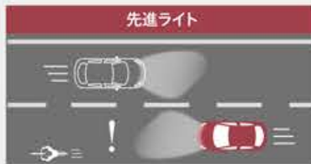
【ALH TM 】 & 【HBC TM 】 ヘッドランプのハイビームを自動制御し、夜間運転中の視認性を高めます。