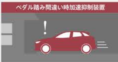
AT誤発進抑制制御 TM 【前進時 TM 】 ペダルの踏み間違いによる急発進を抑制します。