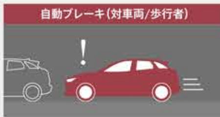
【アドバンス SCBS TM 】 ブレーキの自動制御で、衝突の被害を軽減します。