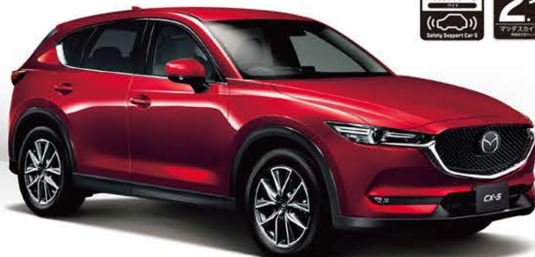
Body Color: ソウルレッドクワスタルメタリック(特別塗装色)

25S L Package [高効率直噴ガソリンエンジン] SKYACTIV-G 2.5 2.5L ガソリンエンジン 2WD (6EC-AT) (G243A0)