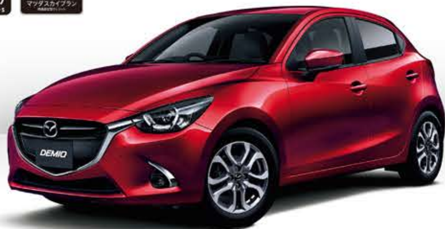
Body Color: ソウルレッドクワスタルメタリック(特別塗装色)

XD Touring [クリーンディーゼルエンジン] SKYACTIV-D 1.5 1.5L ディーゼルエンジン 2WD (6EC-AT) (VB2310)