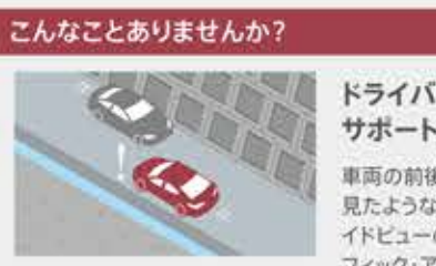
見通しの悪い交差点に差し掛かるとき、突然現れた人やクルマにヒヤリ!