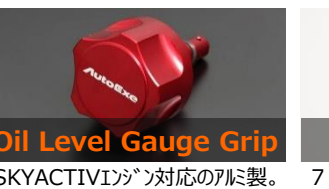
Oil Level Gauge Grip