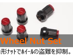
Wheel Nut Set