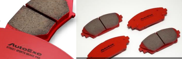
Street Sports B.Pad

ブレーキの最終的な目的は止まることだとしても、走りを愉しむドライバーにとっては「減速」も重要な意味を持ちます。コーナーの入り口で踏むブレーキは、まさに車体の姿勢をコントロールし、次の加速への準備が目的。だから、どの程度の減速を目指し、どれだけの力でペダルを踏めばよいか...というドライバーの期待と操作が、適度な減速に直結しなければなりません。 概念的にブレーキの制動力は「踏力×摩擦係数(μ)」の比例と考えることができ、踏力が一定ならμが大きい方が効きの優位性が高まり、μが一定なら制動力は踏力だけに比例するので、コントロール性が向上し人馬一体の運転感覚が得られます。 例えば、Rが異なるカーブが複合しているワインディングでは、2回、3回と連続したブレーキペダルの操作を強いられます。その都度、μが変化しているのは、コーナー毎にどのくらい意のままの運転を堪能するための、ブレーキシステムに求められる性能は、「人間の感性にシンクロした効き味」のセッティングなのです。