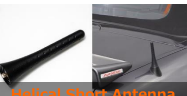
Helical Short Antenna