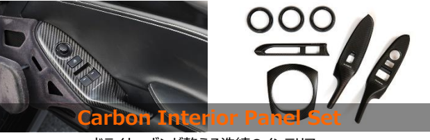
Carbon Interior Panel Set