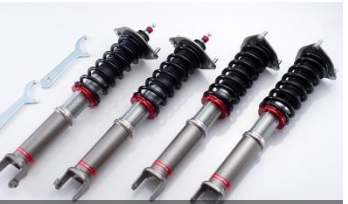
Club Sports SUS.Kit

低重心&高ロール剛性モデル。基準車高は-30mm。ダンパーは高負荷時の熱変換能力に秀で、減衰特性の変化が少ないモノチューブ式。組み合わせるスプリングは、バネ定数がリアに立ち上がる直巻きタイプを採用。ギャップでの吸収性を考慮しつつ、可能な限り高ロール剛性をバックです。スピードレンジを問わず変化感の高いリッドな運転感覚を創出します。