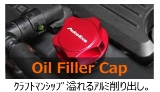
Oil Filler Cap