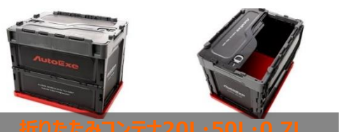
折りたたみコンテナ20L・50L・0.7L

マツダ車専門のオプションメーカーで、「運転する愉しさ」と「快適性」の調和をテーマに商品開発を行っているスペシャリスト。小さい組織のメリットを活かし、フレキシブルな少量生産システムでマツダ車の長所を活かしたパーツ開発を行っています。手軽に装着できるスタイリッシュなアイテムから、本格チューニングパーツまで幅広い製品展開が魅力です。