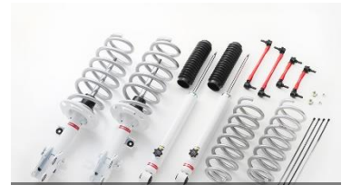
Active Xross SUS.Kit

ラフロードの走破性、ストリートでの操縦性。微低速領域からの減衰力の立ち上がりによって、量産形状ツインチューブダンパーと、車高を約25mmアップさせた専用スプリングの組み合わせにより、悪路走破性と運動性能をバランス。リアには減衰力調整機構を考慮しつつ、可能な限り高ロール剛性をバックです。スピードレンジを問わず変化感の高いリッドな運転感覚を創出します。