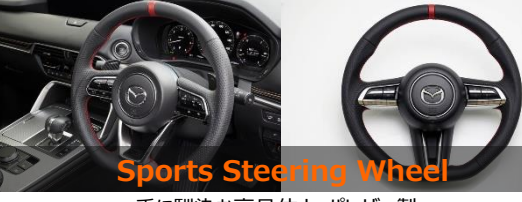
Sports Steering Wheel