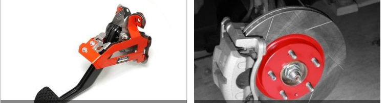
Brake Pedal Brace Street Brake Rotor

次のアクションを準備するために。ブレーキは「終わり」ではなく、「始まり」と考えたい。